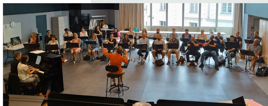
Invitation à une répétition du chœur de l'Opéra du théâtre Graslin de Nantes