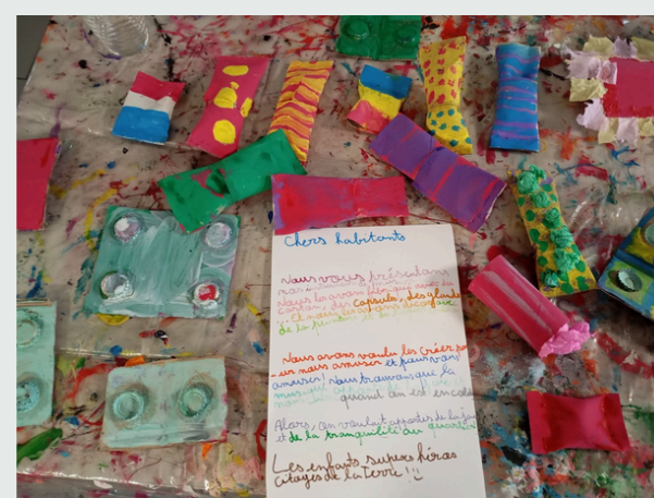
Création d'instruments de musique à partir de matériaux de récup'