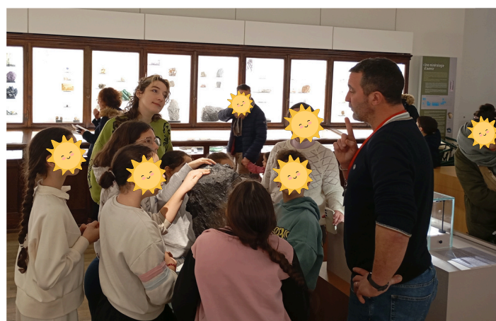
Sortie au Muséum d'Histoire Naturelle