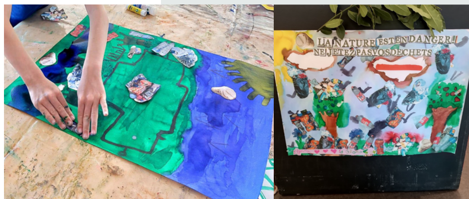
Créations d'affiches pour sensibiliser les habitants autour de la protection de l'environnement. Exposition à la bibliothèque Luce Courville/ Nantes Nord

des ateliers d'avril 2024 à février 2025