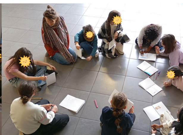
Création et partage du livret Enfants Citoyens