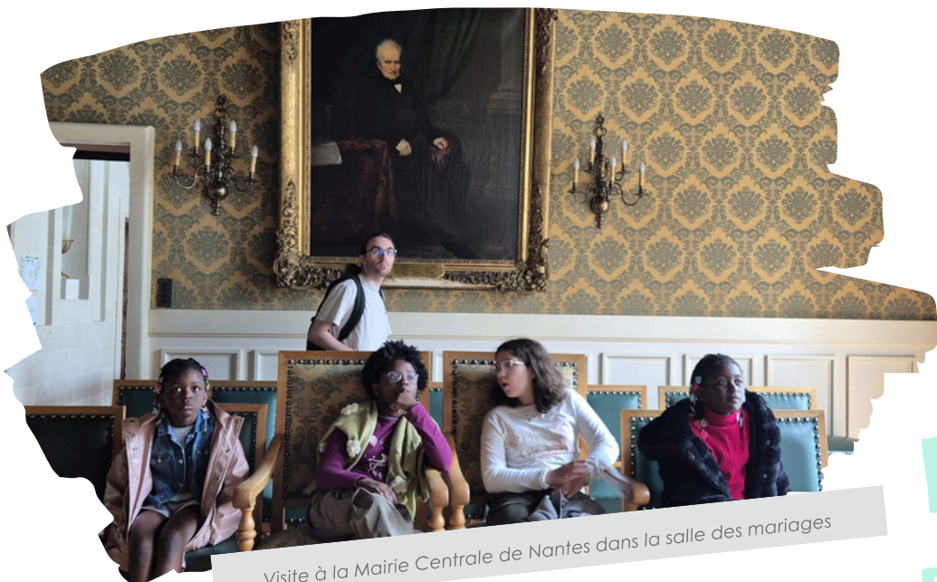
Visite à la Mairie Centrale de Nantes dans la salle des mariages