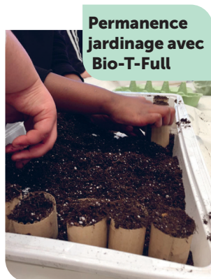
Permanence jardinage avec Bio-T-Full