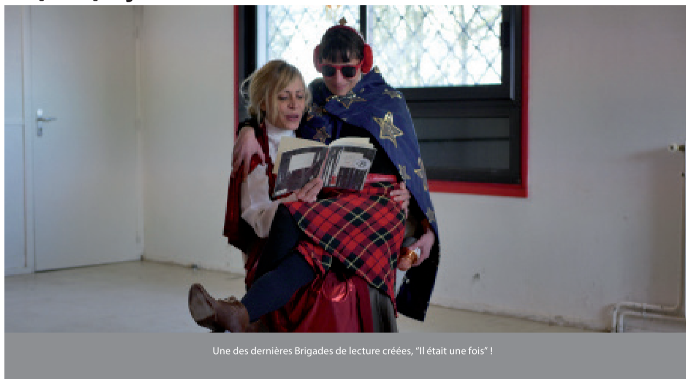
Une des dernières Brigades de lecture créées, "Il était une fois" !

Les Brigades de lecture, à coup sûr, vous avez déjà dû en entendre parler ! Dans une école, dans un hall d'immeuble ou à l'angle d'un square, ces drôles de personnages ne vous sont peut-être pas inconnus.