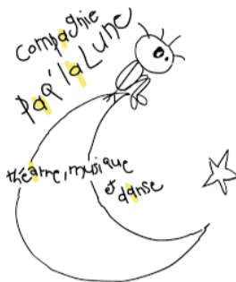
Un des premiers logos de l'association !

Envoie-nous ta plus belle définition par mail : communication@paqlalune.fr