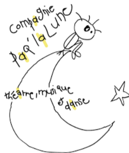
Un des premiers logos de l'association !

Envoie-nous ta plus belle définition par mail : communication@paqlalune.fr