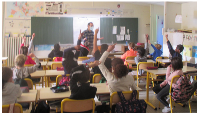
Regarde ! Un atelier d'écriture sur temps scolaire.

halls d'immeuble avec chaque semaine une nouvelle affiche contenant un petit message. Bref... Si le monde ralentit, PaQ'la Lune rebondit !