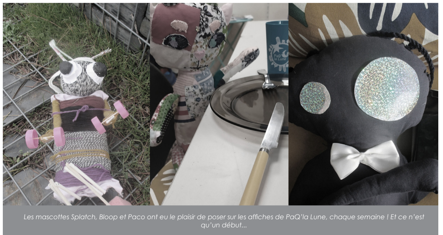
Les mascottes Splatch, Bloop et Paco ont eu le plaisir de poser sur les affiches de PaQ'la Lune, chaque semaine ! Et ce n'est qu'un début...